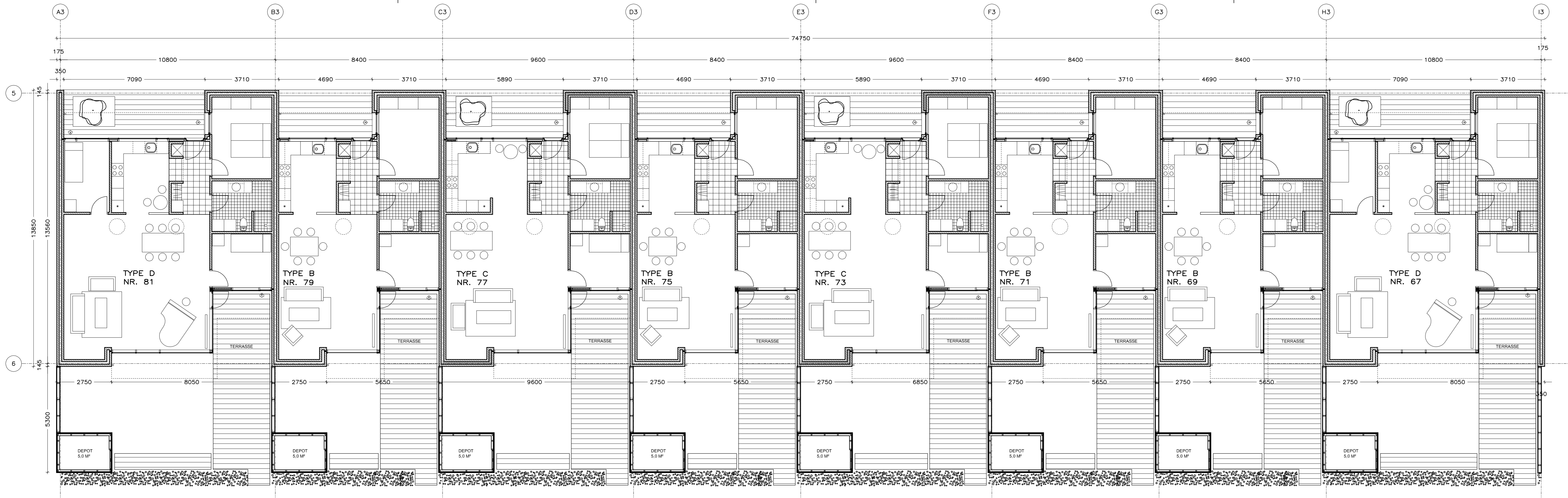
PLAN - BLOK 3