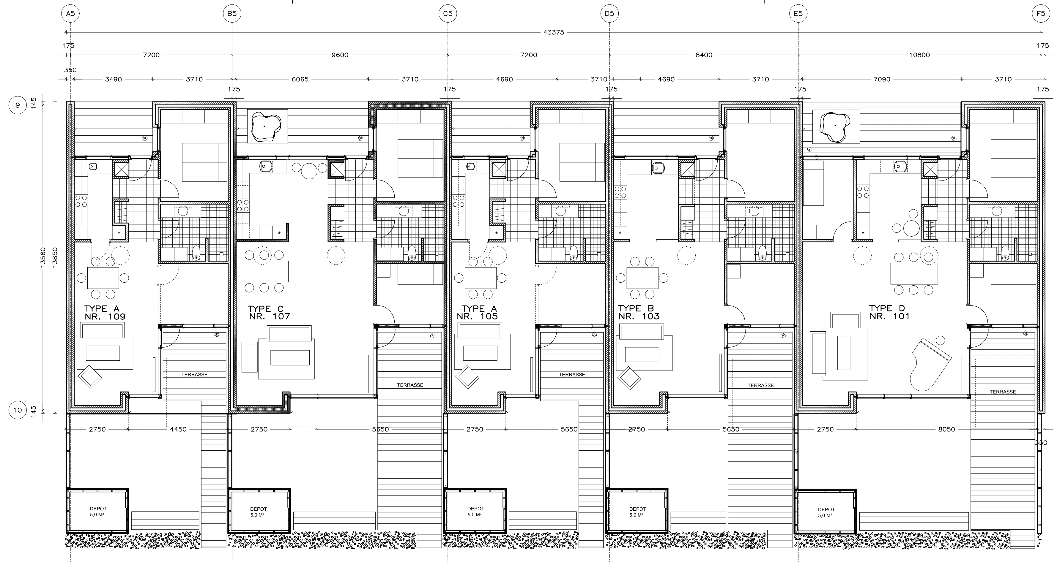
PLAN - BLOK 5